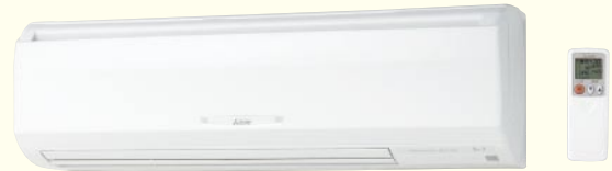
専用ワイヤレスリモコン(同梱) PKH-RP56~80KAL10形