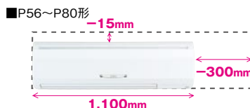
従来形MPK-RP80FAL2形との比較