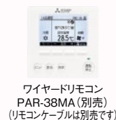
ワイヤードリモコン PAR-38MA (別売) (リモコンケーブルは別売です)