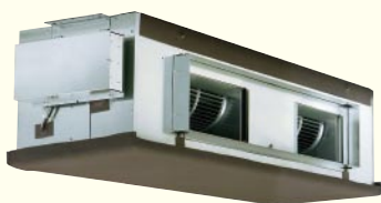
吹出ダクトフランジを標準装備。